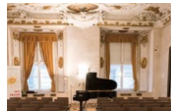
ウィーン公演会場イメージ